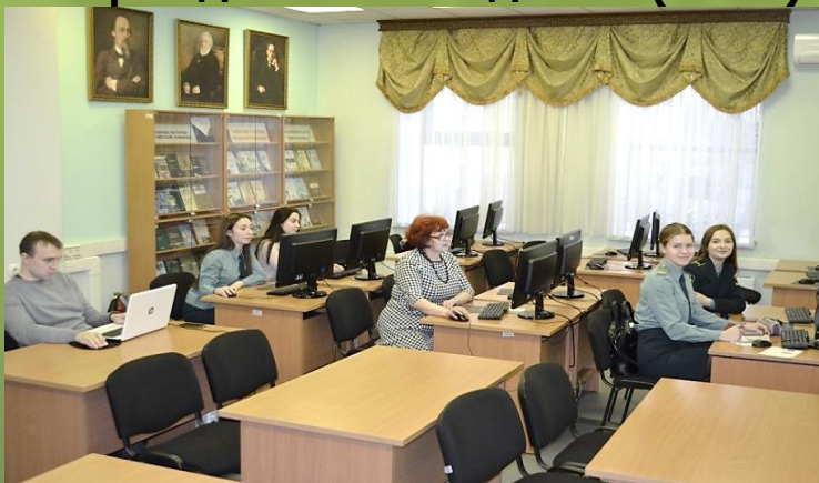
Читальный зал книг и периодических изданий (к.202)