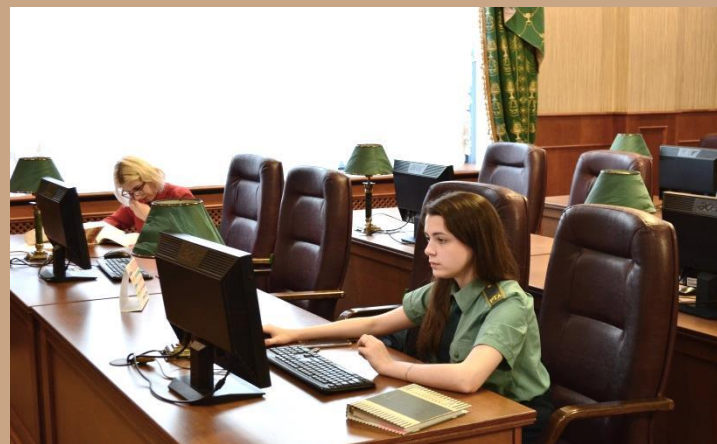
Читальный зал электронной библиотеки (к.301)